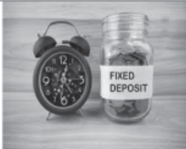
મેળવો ડીપોઝીટ ઉપર ૯૦% સુધી નો ઓવર ડ્રાફ્ટ