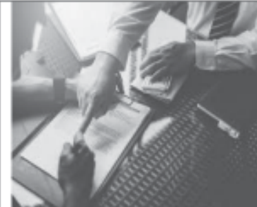
ઘંઘો વિકસાવા માટે લીમીટવાળી લોન