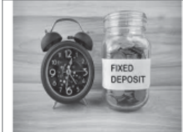
મેળવો ડીપોઝીટ ઉપર ૯૦% સુધી નો ઓવર ડ્રાફ્ટ